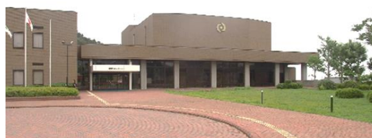
図 楢葉町コミュニティセンター外観